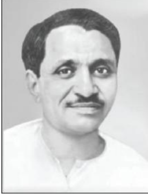
पं. दीनदयाल उपाध्याय जी